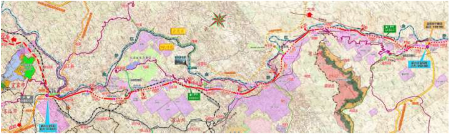
图 1 项目路线总体平面图

流而上，依次经过上田坝乡、向岭乡、卡哈洛乡、岩脚乡、德溪乡、热水河乡，最终在芦稿镇油坊村附近对接 G4216 线金阳至宁南段，并与 G7611 昭西高速形成芦稿枢纽互通，项目路线总体平面图详见图 1。