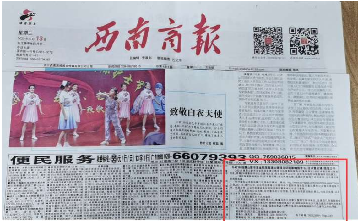
图 3.2-6 第一次登报公示