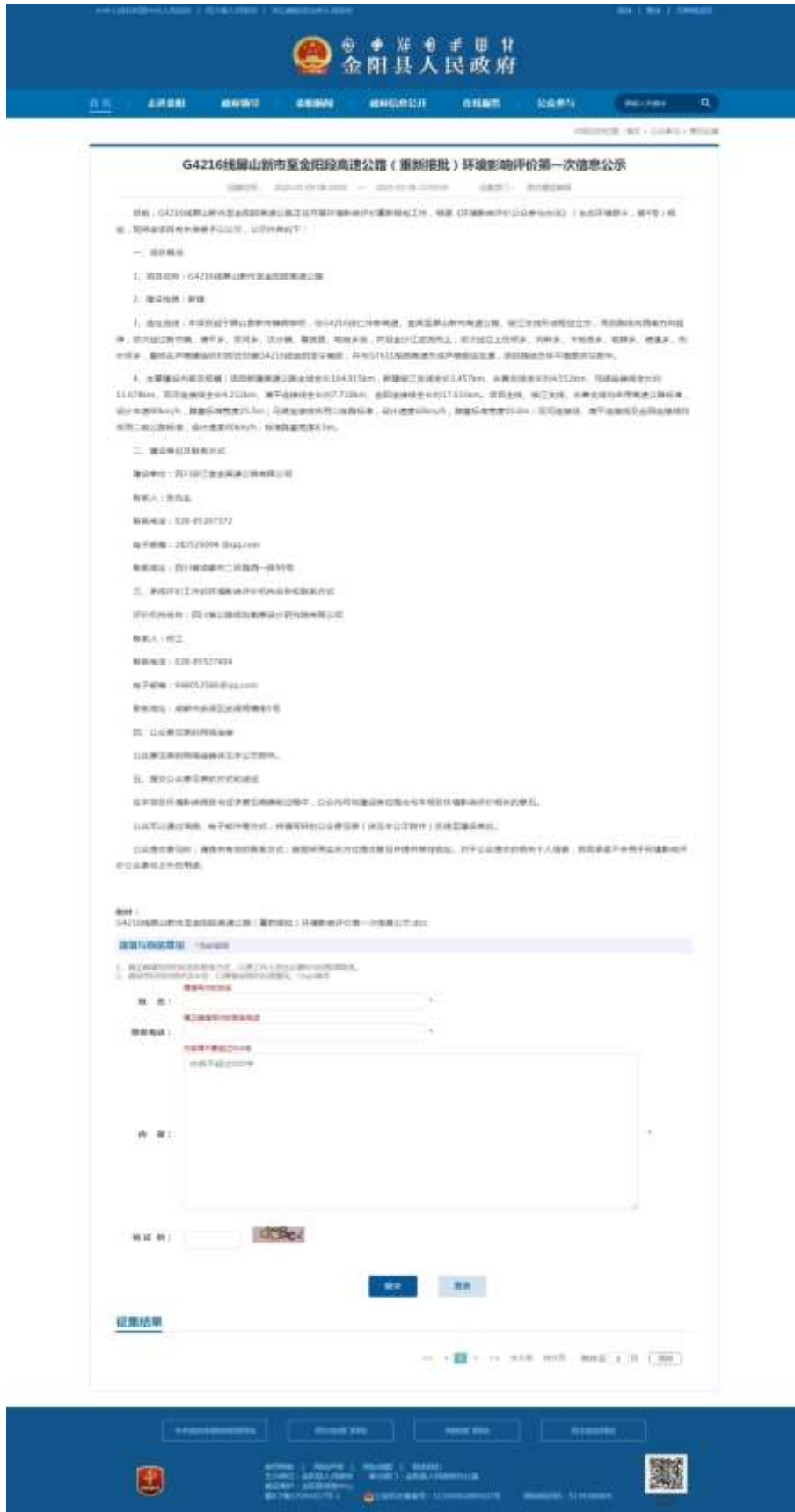
图 2.2-3 金阳县人民政府网站第一次网络公示截图