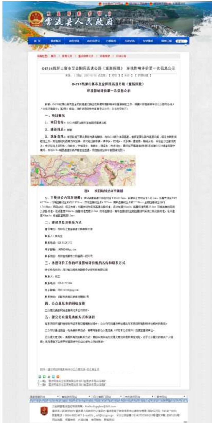
图 2.2-4 雷波县人民政府网站第一次网络公示截图