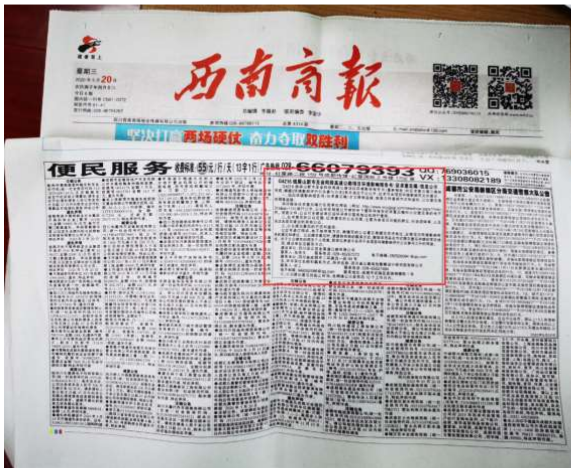
图 3.2-7 第二次登报公示