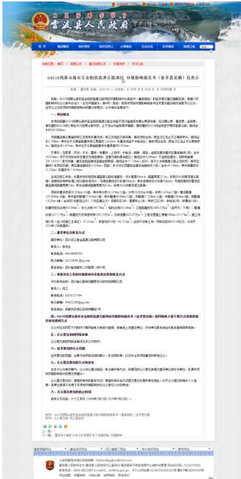
图 3.2-4 雷波县人民政府网站环评征求意见稿网络公示截图