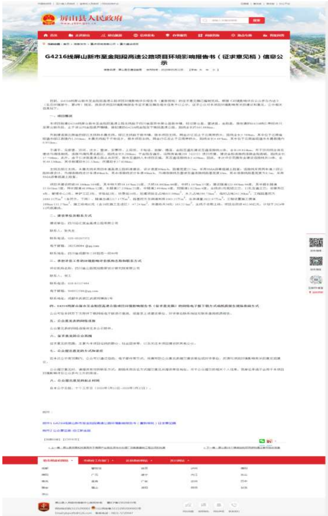
图 3.2-5 屏山县人民政府网站环评征求意见稿网络公示截图