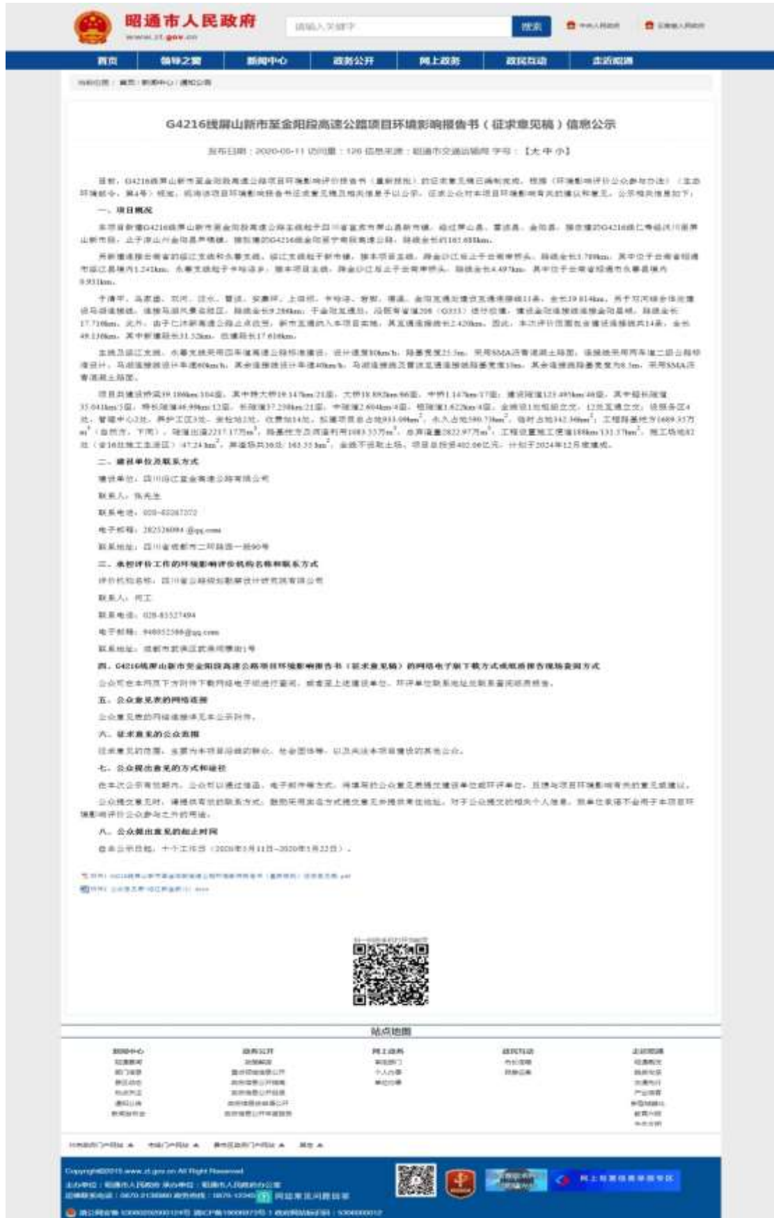
图 3.2-2 昭通市人民政府网站环评征求意见稿网络公示截图