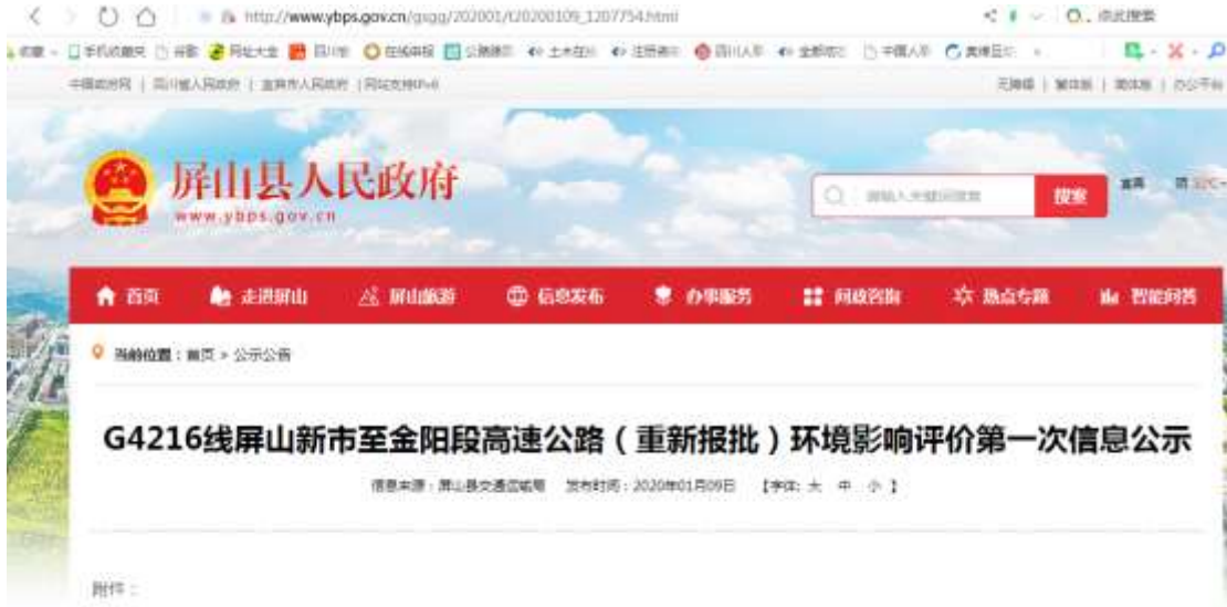
G4216线屏山新市至金阳段高速公路（重新报批）环境影响评价第一次信息公示