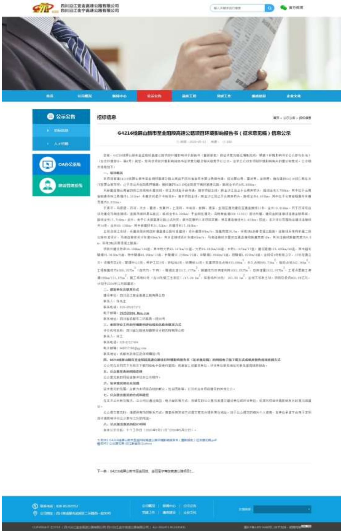
图 3.2-1 建设单位-沿江公司环评征求意见稿网络公示截图