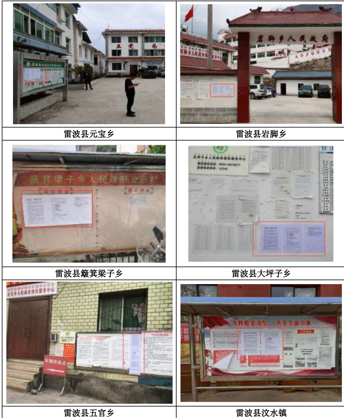
图 3.2-8 现场张贴公示公告代表性照片