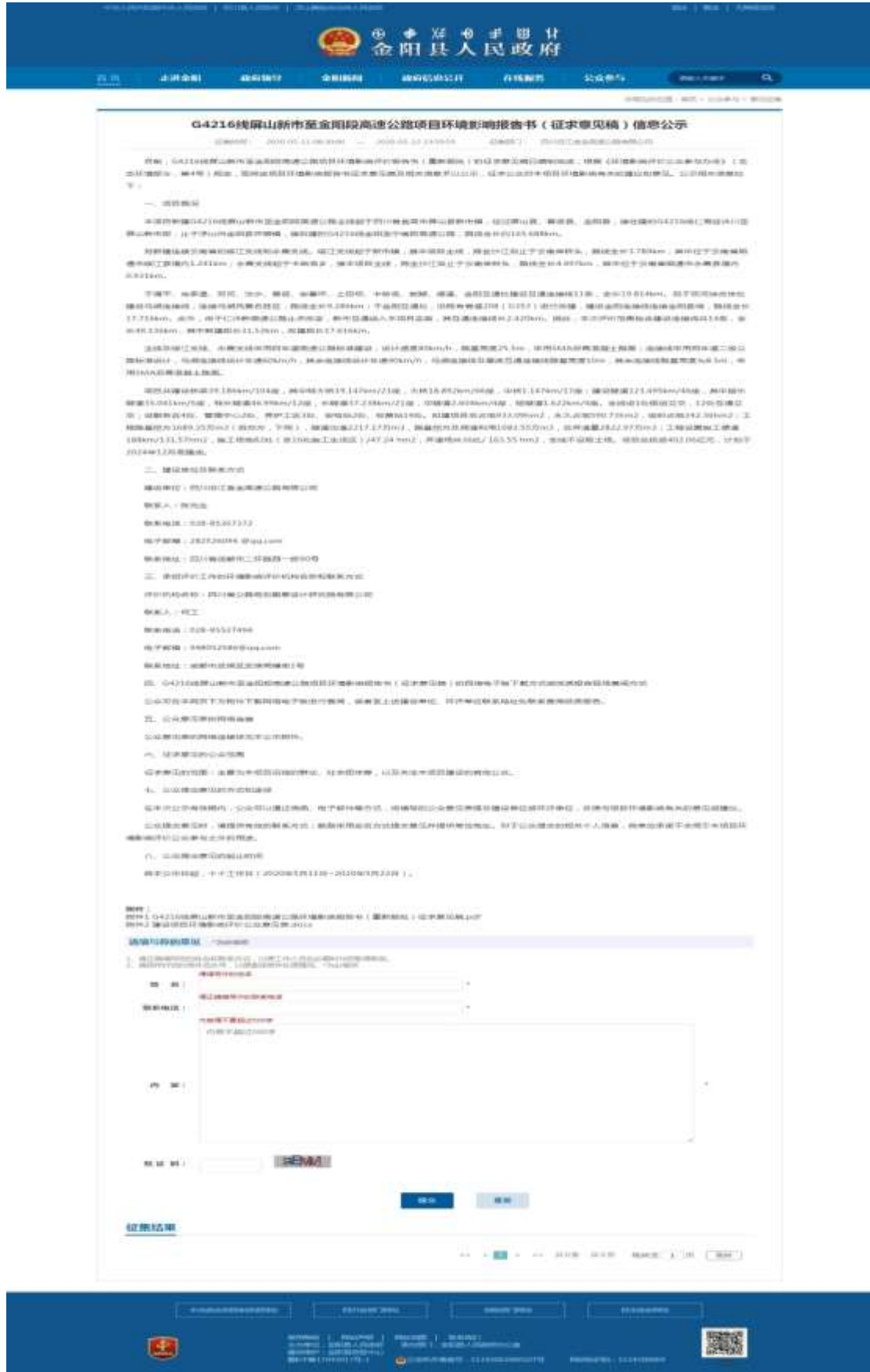
图 3.2-3 金阳县人民政府网站环评征求意见稿网络公示截图