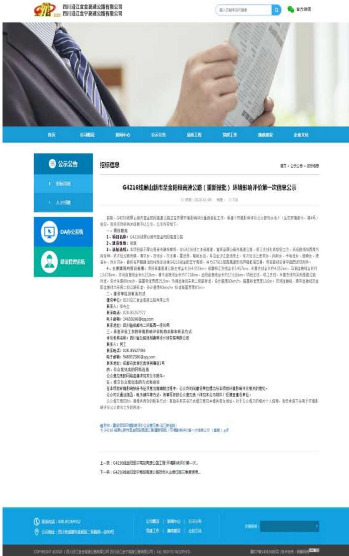
图 2.2-1 建设单位-沿江公司网站第一次网络公示截图