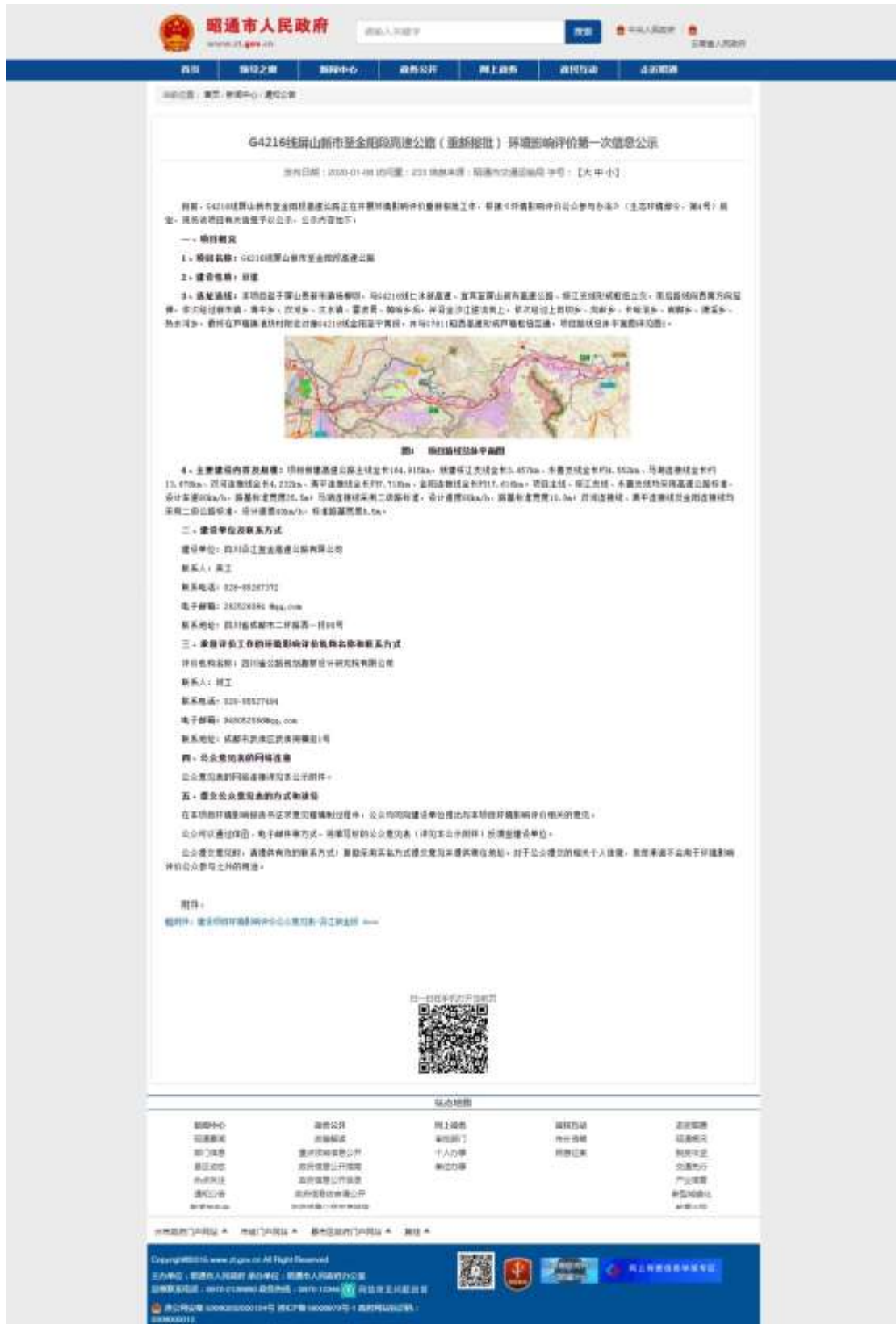
图 2.2-2 云南省昭通市人民政府网站第一次网络公示截图