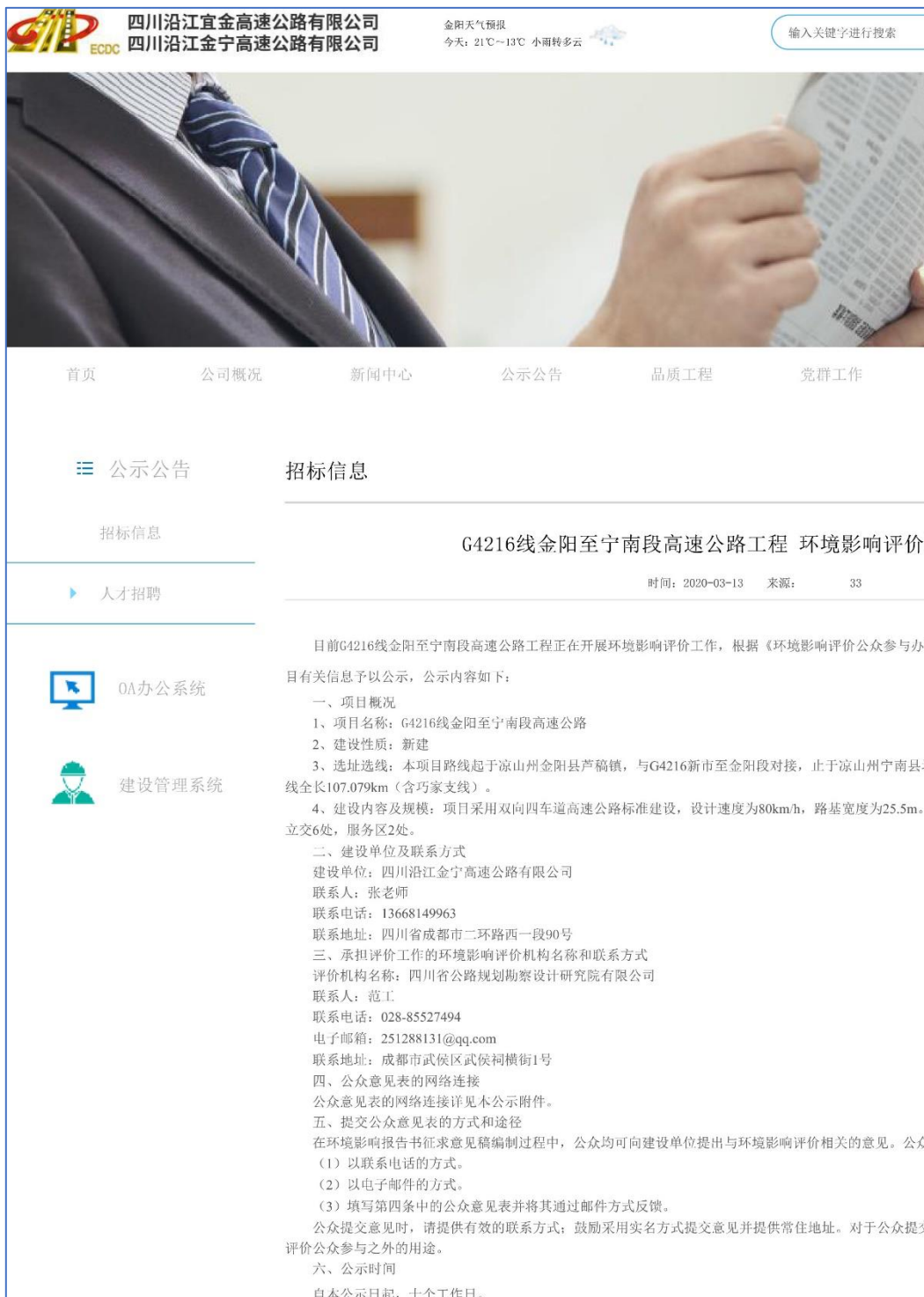
图 2.2-1 建设单位网站第一次公示截图