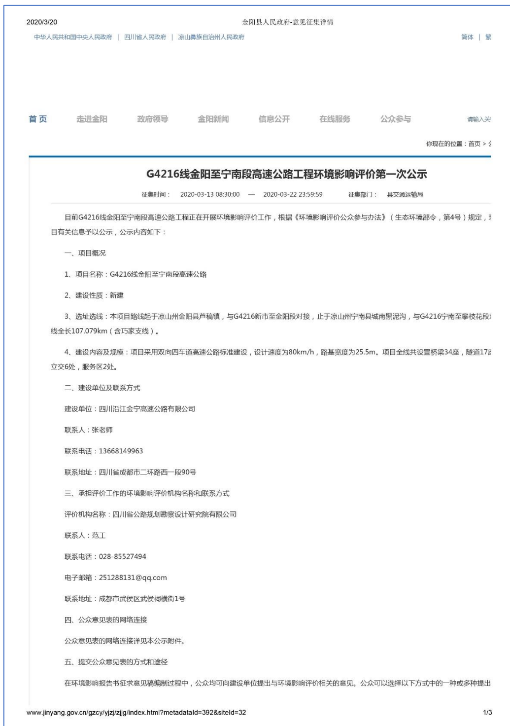
图 2.2-2 金阳县人民政府网站第一次公示截图