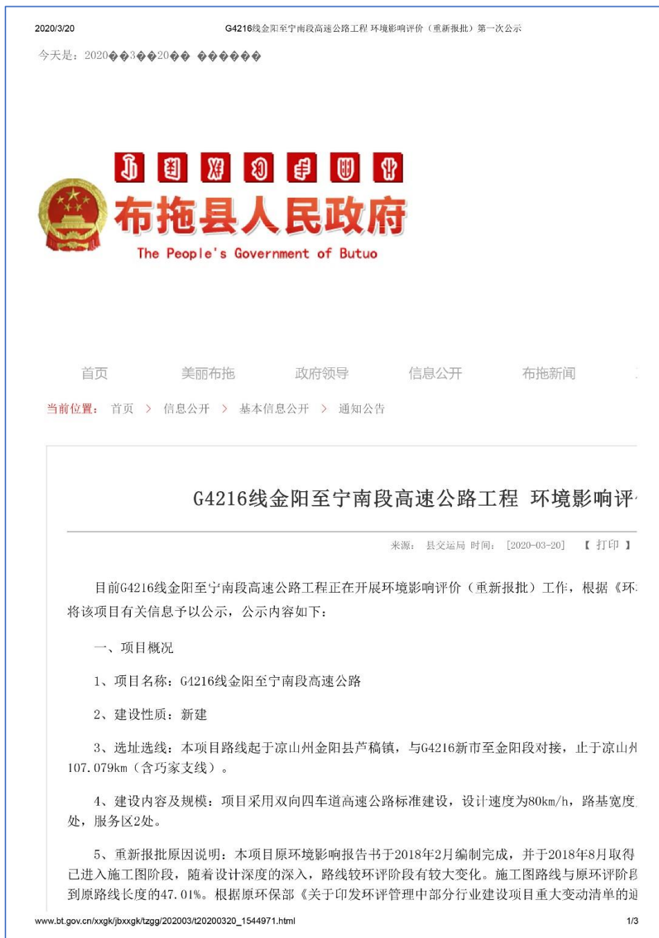
图 2.2-3 布拖县人民政府网站第一次公示截图