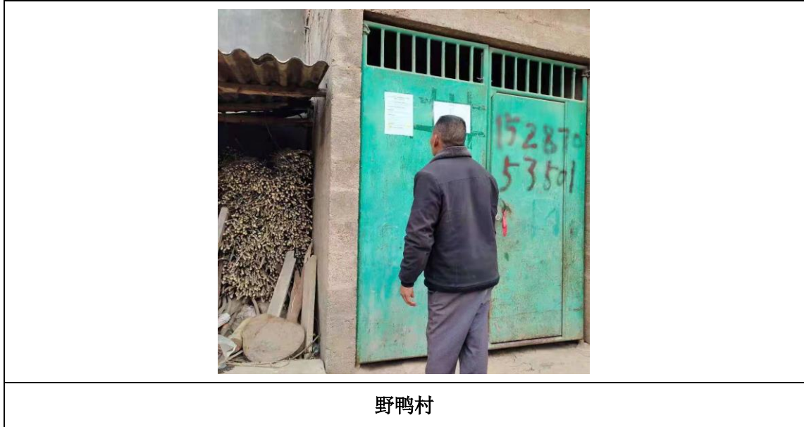
图 3.2-6 现场张贴公示公告照片