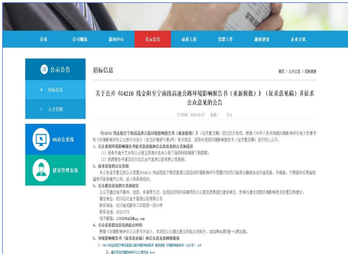
图 3.2-1 四川沿江宜金高速公路有限公司网站环评征求意见稿网络公示截图