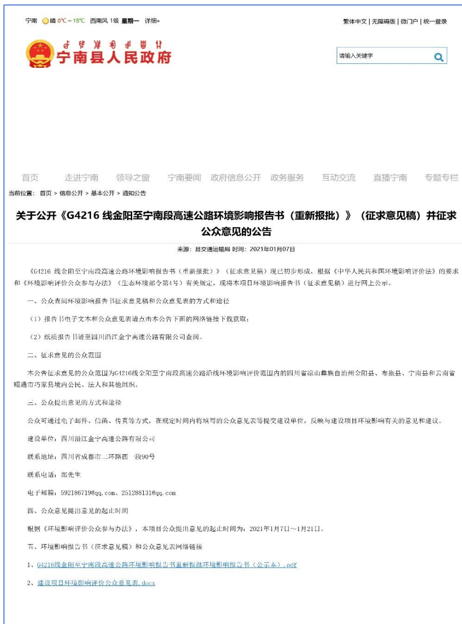
图 3.2-3 宁南县人民政府网站环评征求意见稿网络公示截图