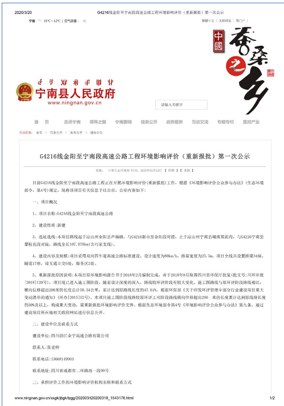
图 2.2-4 宁南县人民政府网站第一次公示截图