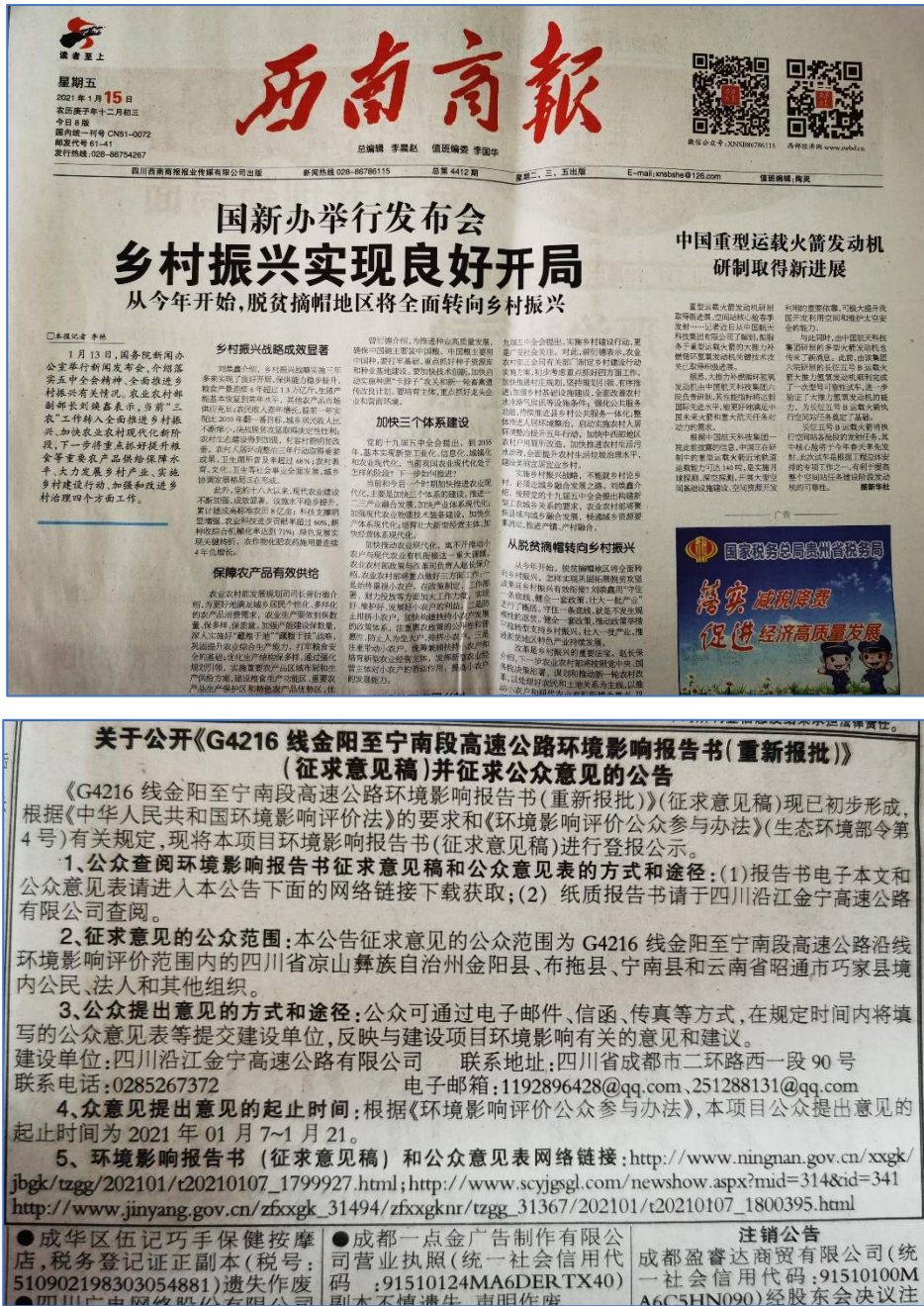
图 3.2-4 第二次登报公示