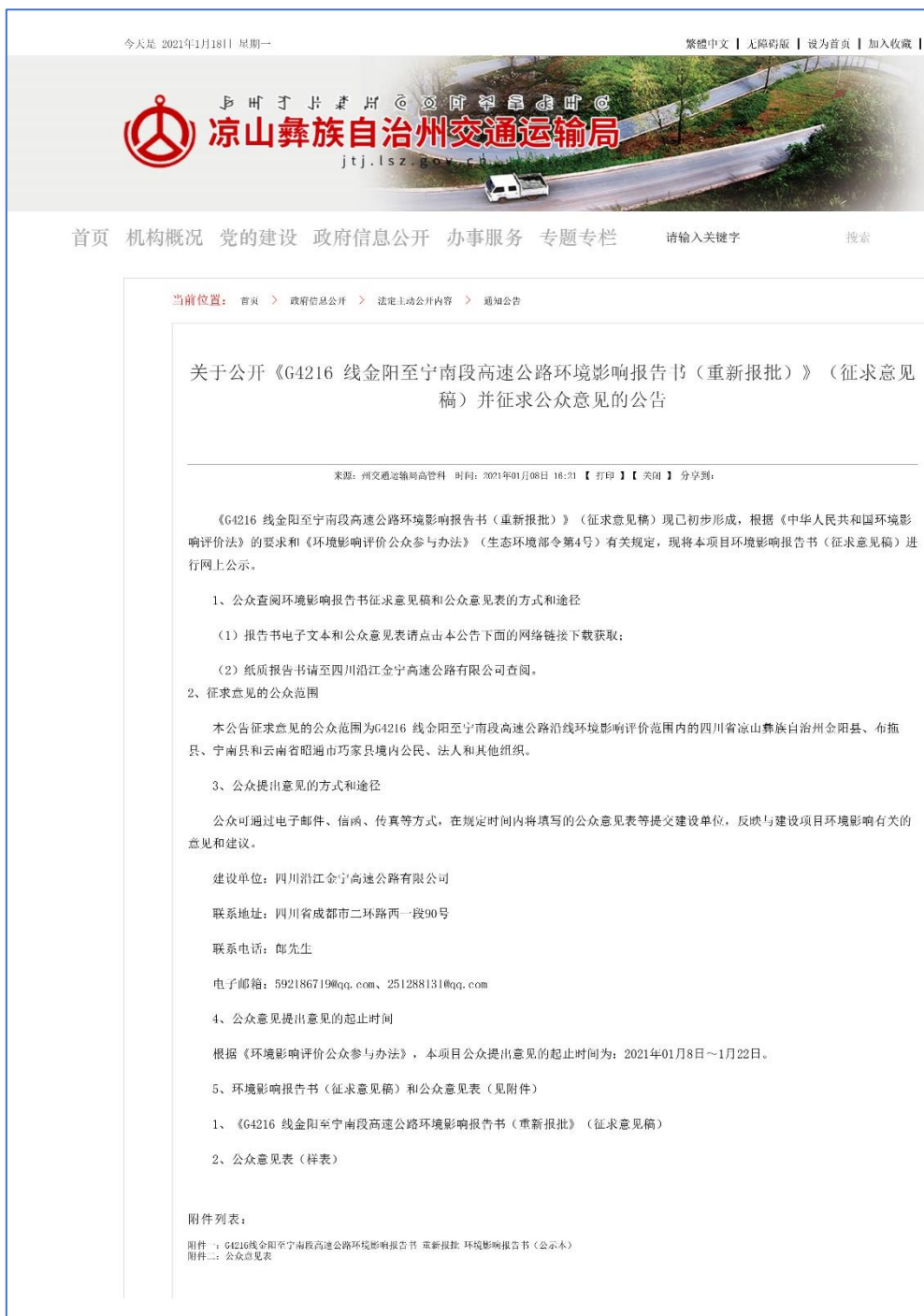
图 3.2-4 凉山州交通运输局网站环评征求意见稿网络公示截图